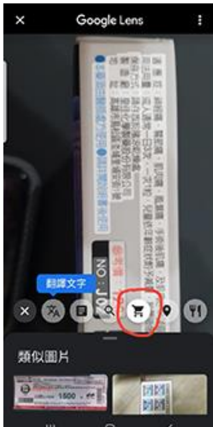
搜尋類似的文字或圖片在哪裡有賣