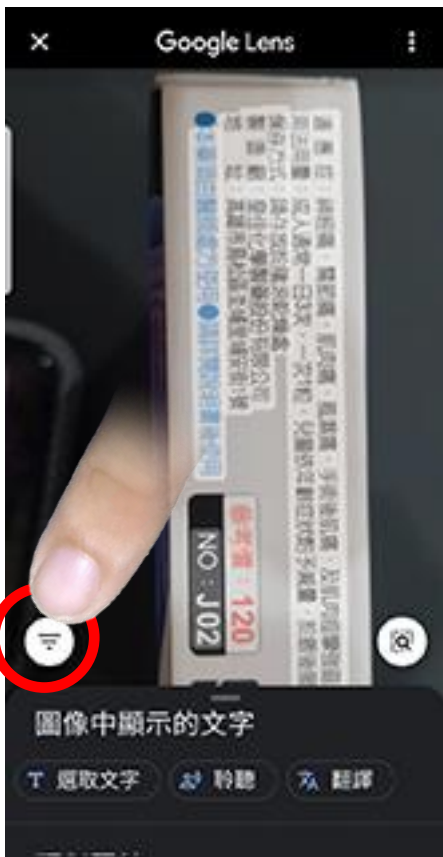
點選此處會跳出辨識型態選單