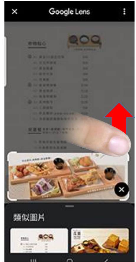
可拖拉四個角選取要辨識的範圍