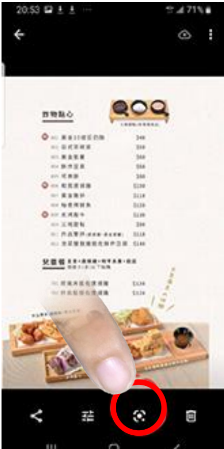
點選此處 Google Len 符號