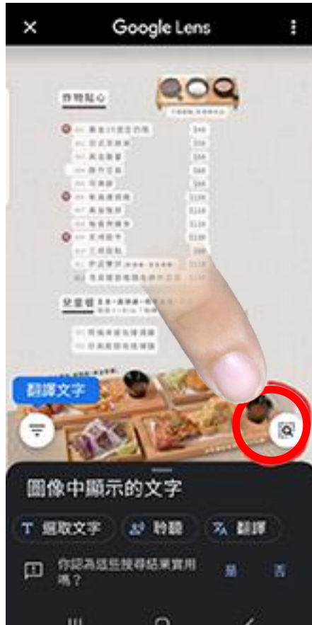
點選選取部分圖片