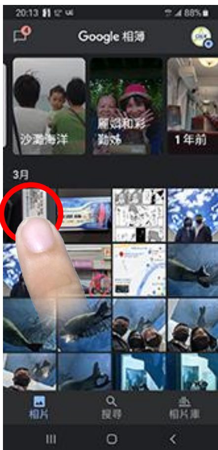
點選從 Lien 下載的圖片