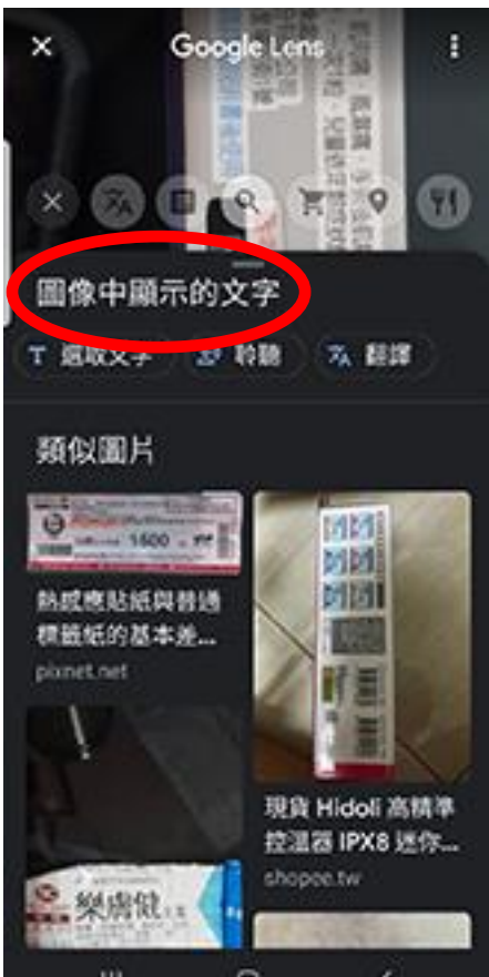
顯示搜尋類似的文字或圖片結果