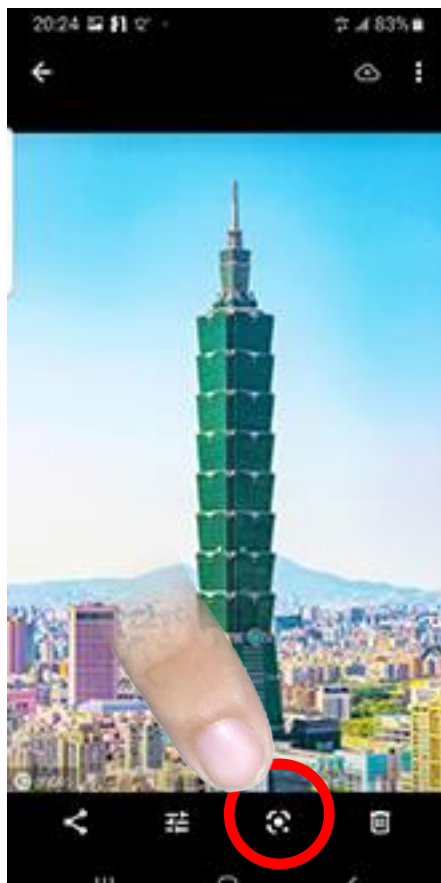
點選此處 Google Len 符號