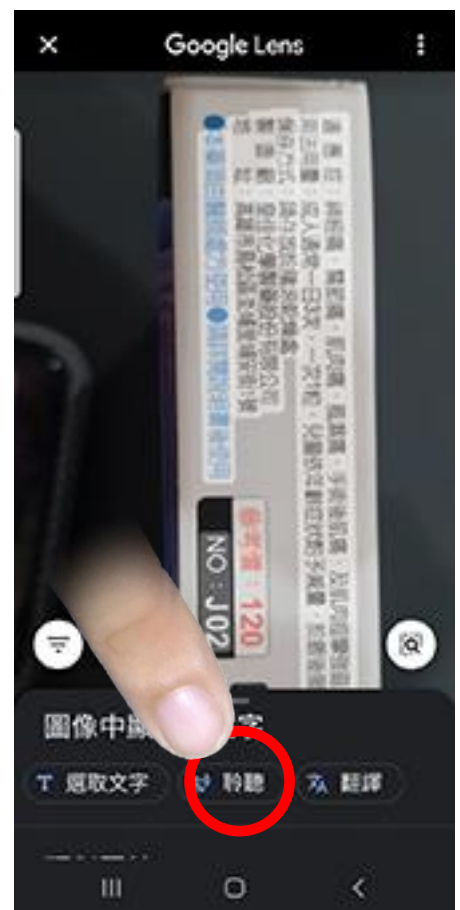
點選聆聽，會說出照片內的文字