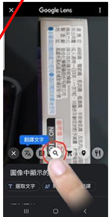
搜尋類似的文字或圖片