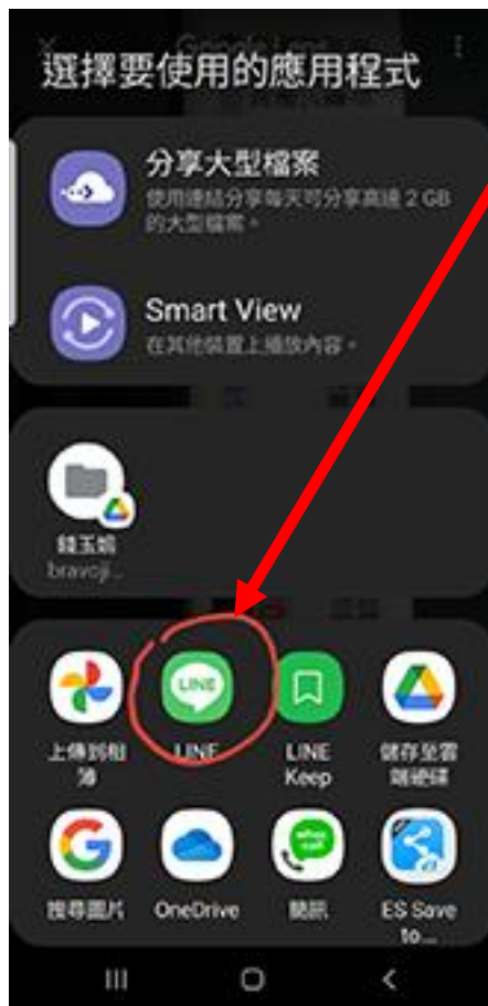
將辨識的文字分享到 Line