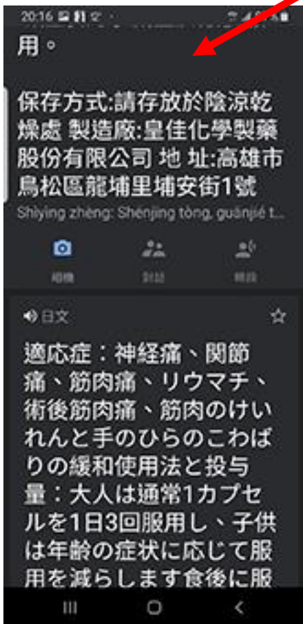
跳到 Google 翻譯