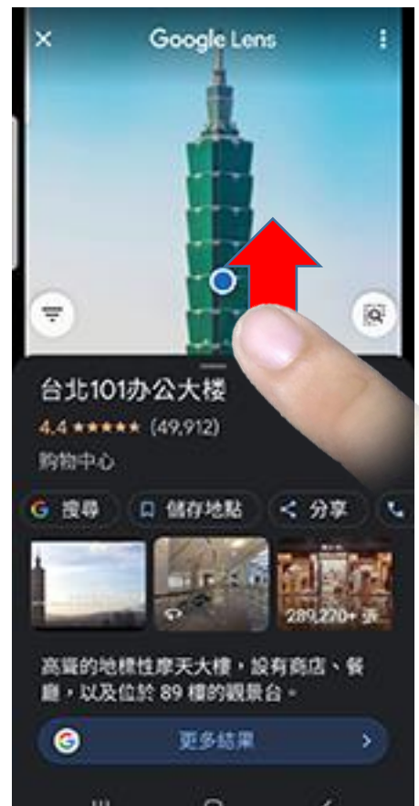
顯示辨識結果，往上移動可以看到更多的搜尋結果