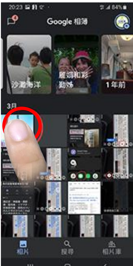
點選從 Lien 下載的圖片 101 大樓