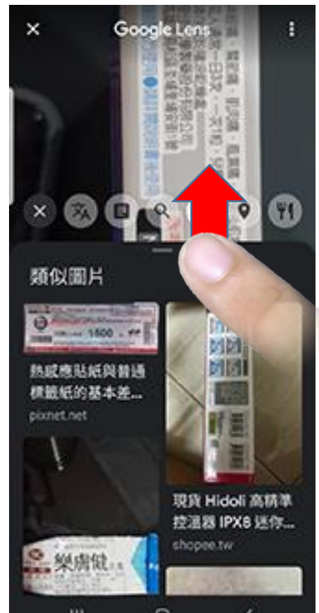
往上移動可以看到更多的搜尋結果